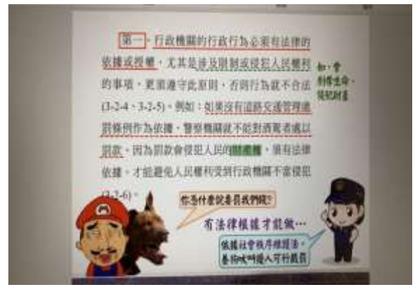
八年級公民科：公民科法律常識中導入經由交通事故中所需負擔之刑罰。