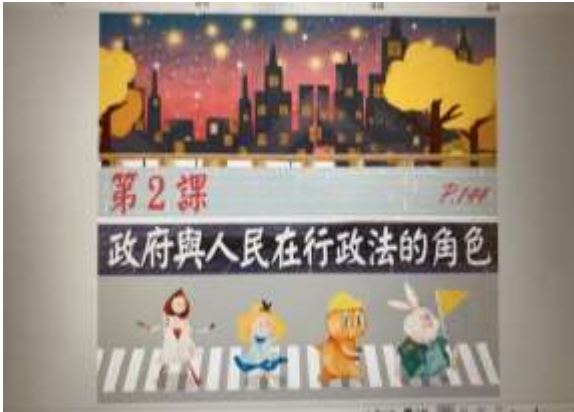
八年級公民科：公民科法律常識中導入經由交通事故中所需負擔之刑罰。