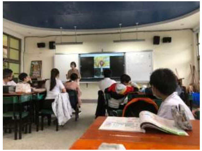
七年級童軍：定向追蹤，校園內的安全號誌