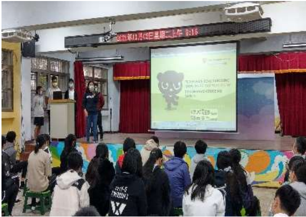
朝會—行人用路宣導