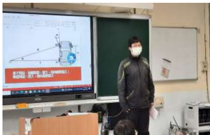
九年級數學：大客車的內輪差