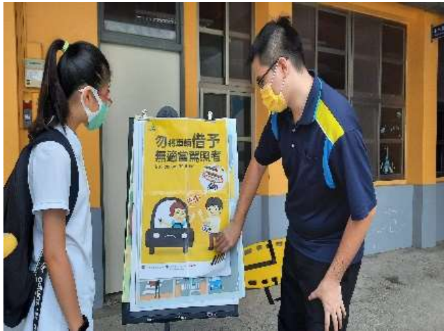
110.10 交通安全月宣導手牌加強宣導