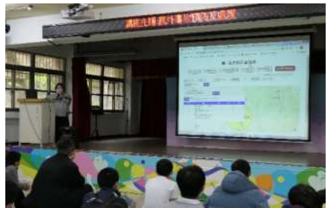
利用道安查詢網站使用方法