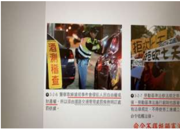
八年級公民科：公民科法律常識中導入經由交通事故中所需負擔之刑罰。