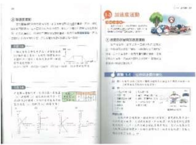
九年級理化科：直線運動告訴你如何計算煞車距離。