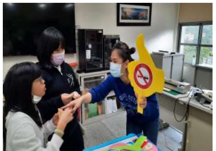
110.10 交通安全月一海報宣導