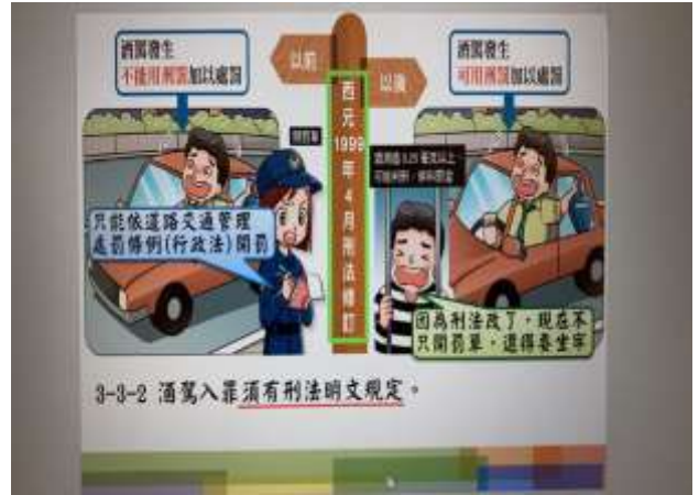
八年級公民科：公民科法律常識中導入經由交通事故中所需負擔之刑罰。