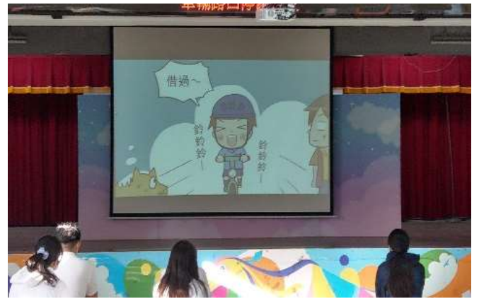
朝會—自行車騎乘安全宣導