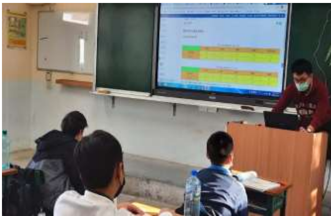
七年級地理：地形變化影響交通事故的發生