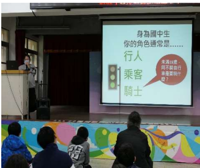
國中生的角色-行人乘客不能是『騎士』