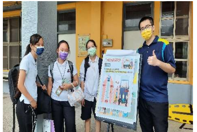
110.10 交通安全月一黑莓來打卡