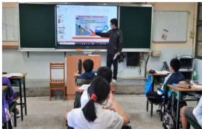
九年級數學：大客車的內輪差