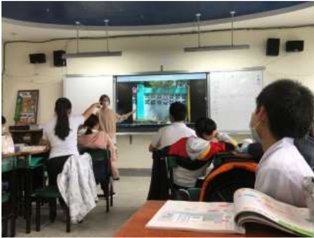
七年級童軍：定向追蹤，校園內的安全號誌